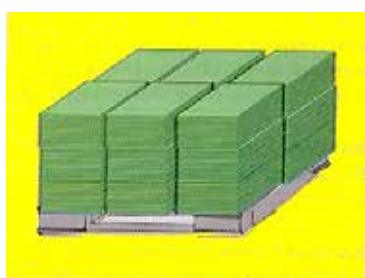
MIX DI BACINI

Es. Spedizioni composte da quantitativi tali da consentire solo la formazione di pallet (almeno 0,5 m 3 ) per miscelanea di bacini.